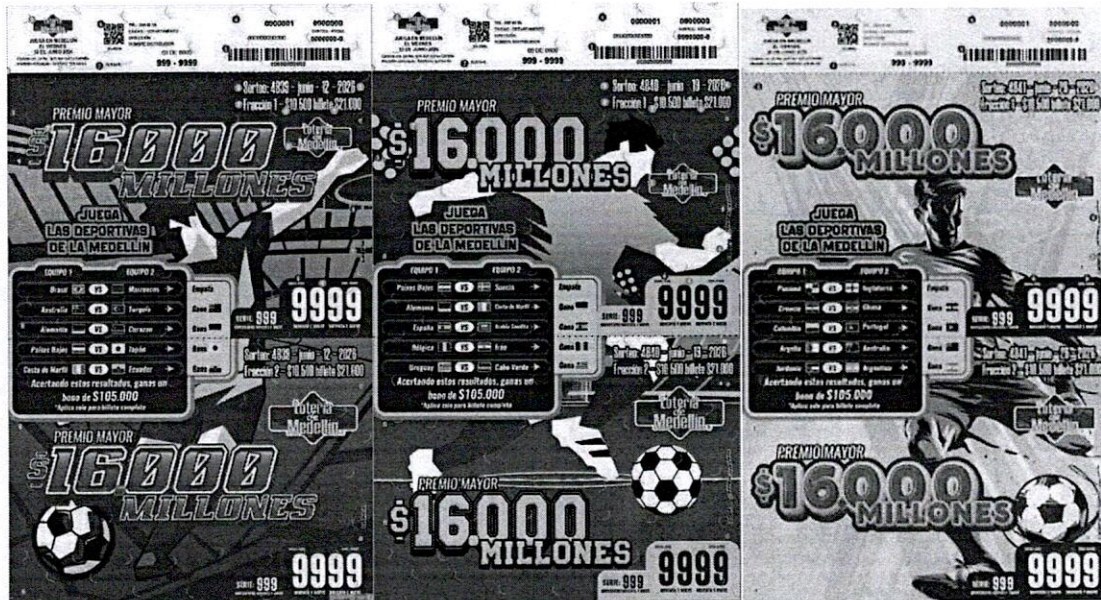
*imágenes de referencia

ARTÍCULO DÉCIMO: BILLETE. Determinar que el cliente podrá encontrar en el mercado el siguiente diseño del billete: